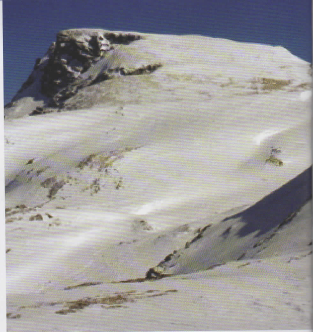
Mont Maliovitsa 2729 m

Après un court trajet en bus, nous démarrons la randonnée du 5 mars au bas de la station de Panitchichte, pour d'abord atteindre le refuge hôtel